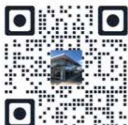
Autohaus Bläse GmbH – Am Gallengraben 2 – 73529 Schwäbisch Gmünd

Das Team vom Autohaus Bläse wünscht eine erfolgreiche Saison!