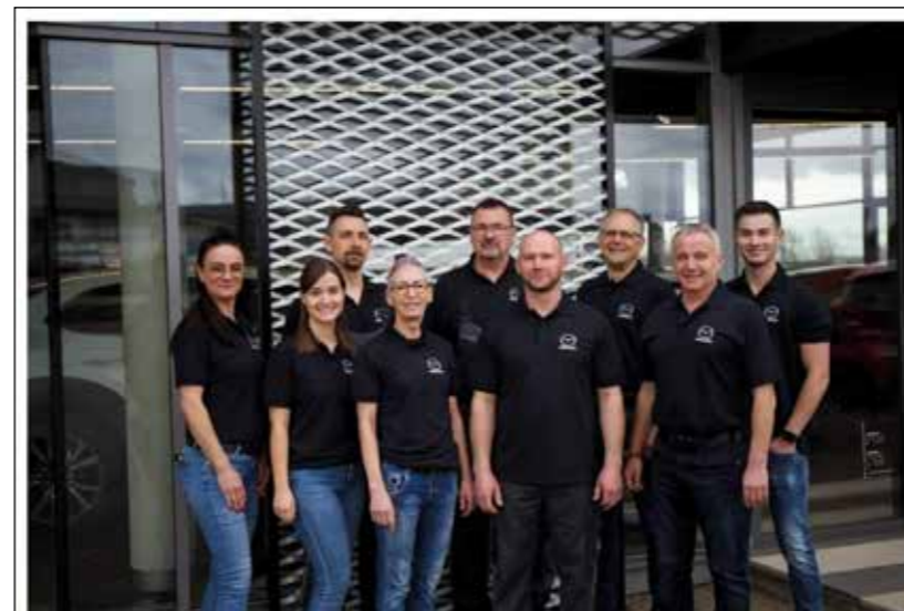
Autohaus Bläse GmbH – Am Gallengraben 2 – 73529 Schwäbisch Gmünd

Das Team vom Autohaus Bläse wünscht eine erfolgreiche Saison!