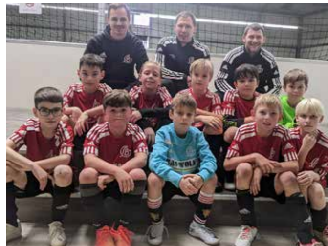
Leistungsvergleich im Squash und Fit