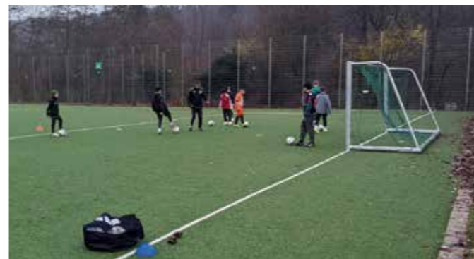
Potenzialtraining (hier mit der D) an der ASR