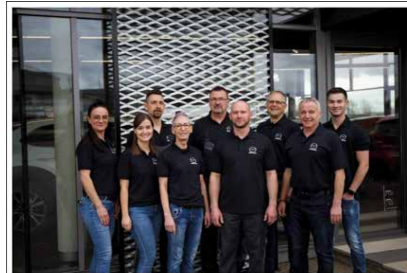
Autohaus Bläse GmbH – Am Gallengraben 2 – 73529 Schwäbisch Gmünd

Das Team vom Autohaus Bläse wünscht eine erfolgreiche Saison!