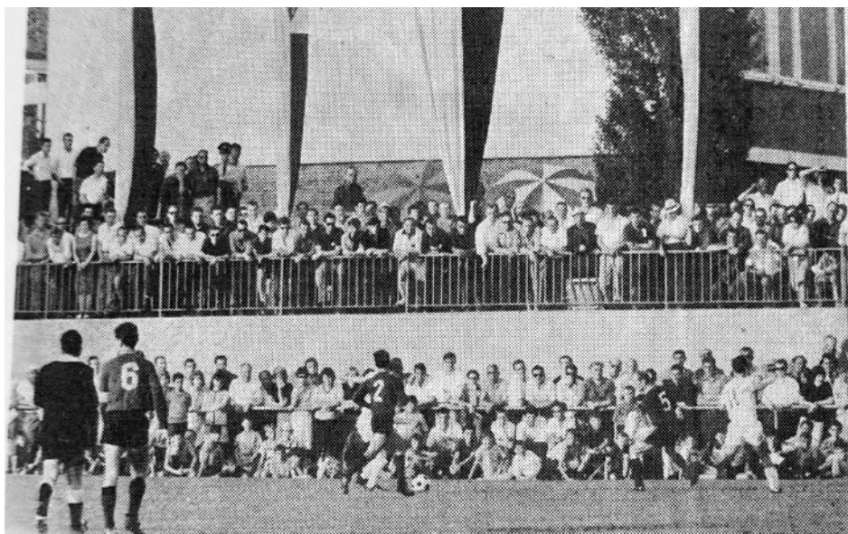
DAS STÄDTISCHE STADION IN BETTRINGEN wurde gestern abend eingeweiht. Rund 4000 Zuschauer hatten sich eingefunden und sahen ein begeistertes Spiel zwischen München 1860, dem deutschen Meister, und einer Auswahl Fils/Rems.