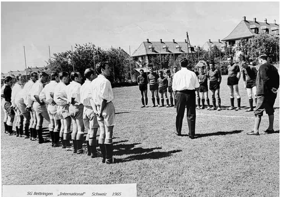
SG Bettringen „International“ Schweiz 1965